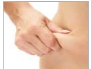
ADIPOSITÀ LOCALIZZATE E P.E.F.S.