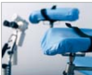
GINECOLOGIA ESTETICA FUNZIONALE