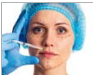
PIEGHE NASOLABIALI E VOLUMETRIE STRUTTURALI