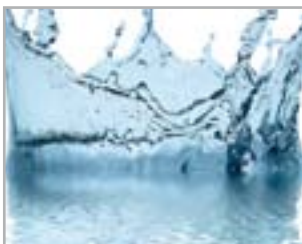
MEDICINA TERMALE E MEDICAL SPA