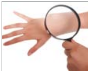
TRATTAMENTO DEGLI INESTETISMI CUTANEI