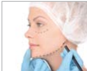
FILI IN MEDICINA ESTETICA