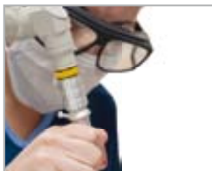
LASER E LUCI