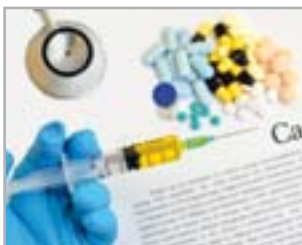
MEDICINA ESTETICA IN ONCOLOGIA