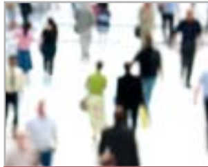
AREA ESPOSITIVA DI OLTRE 1200 METRI QUADRATI