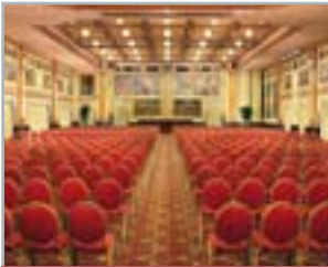
DODICI SALE CONGRESSUALI