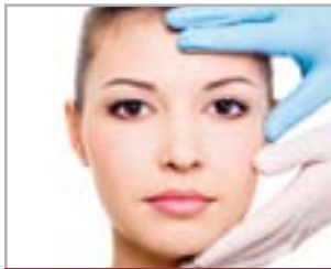
TECNICHE DI RINGIOVANIMENTO