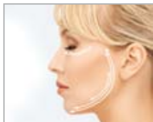
TRATTAMENTO DELLE AREE DIFFICILI