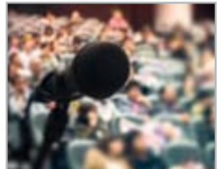
CORSO E.C.M. POST-CONGRESSUALE