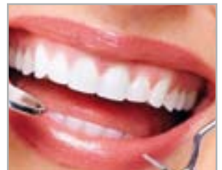
ODONTOIATRIA ESTETICA del distretto anatomico di competenza