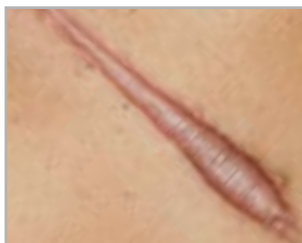
TRATTAMENTO DELLE CICATRICI