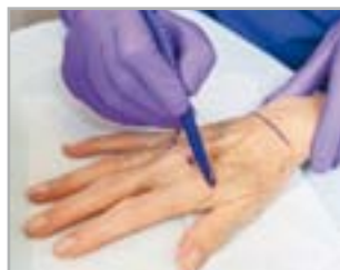
RINGIOVANIMENTO AREE COMPLESSE: LE MANI