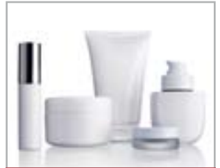
SALONE DELL'INFORMAZIONE SCIENTIFICA COSMETICO E COSMECEUTICO