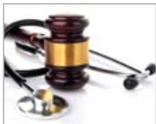
ASPETTI LEGALI ED ASSICURATIVI