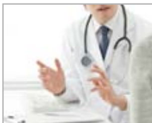
GESTIONE DELLE COMPLICANZE IN MEDICINA ESTETICA