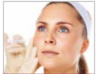
RISTRUTTURAZIONE VISO E CORPO