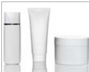
COSMETICI E COSMECEUTICI